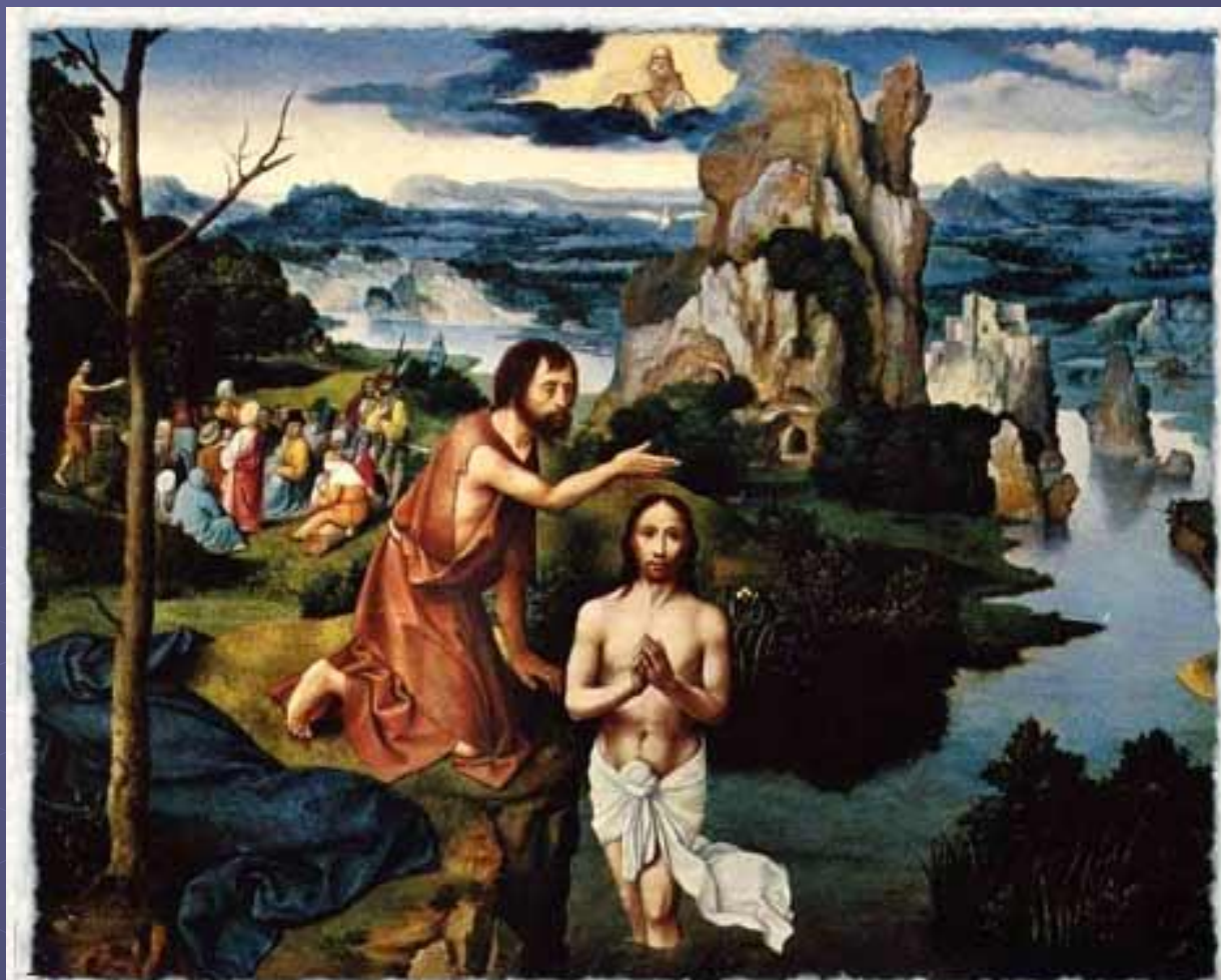
1515/1524 гг. Иоахим Патинир. Крещение Христово. Дерево, масло. 60x77 см. Вена, Музей истории искусств.

Когда Иисусу исполнилось 30 лет, он пришел на реку Иордан к Иоанну Крестителю, чтобы принять от него крещение.