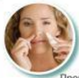
Промывание носа солевым раствором