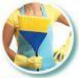
Влажная уборка помещения