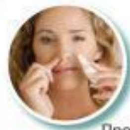
Промывание носа солевым раствором