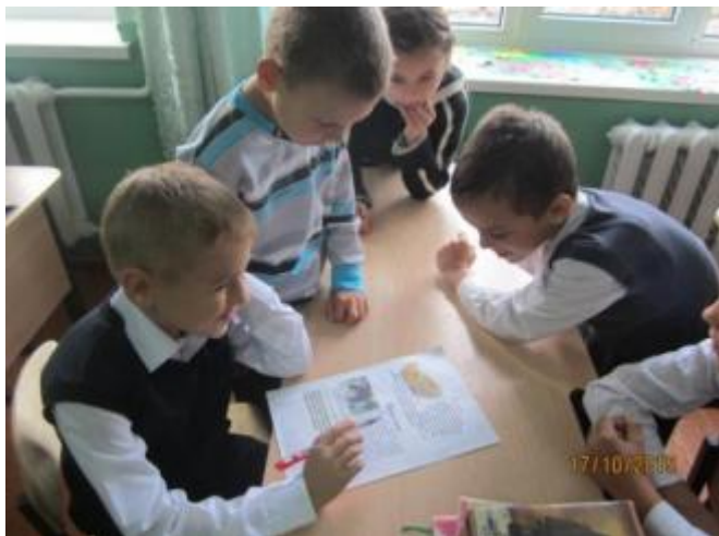
Группа составителей салатов и рецептов