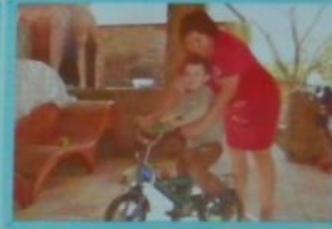
С дочкой на велосипеде