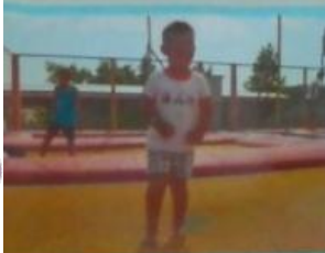
И на теннисе