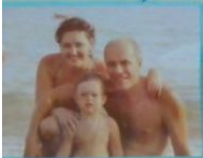
С мамочкой и папочкой