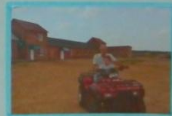
И с папочкой на квадроцикле!