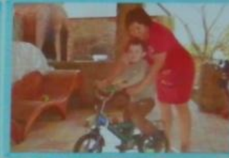
С велосипедом на прогулке