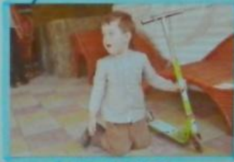
И на самокате