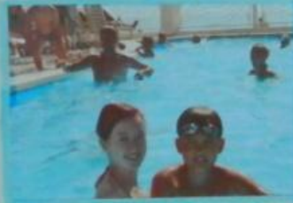
Счастливые мама и папа в бассейне