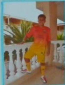
Моя гимнастика - прыжок!