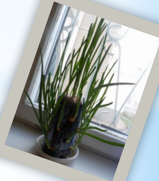
Наше «луковое дерево».