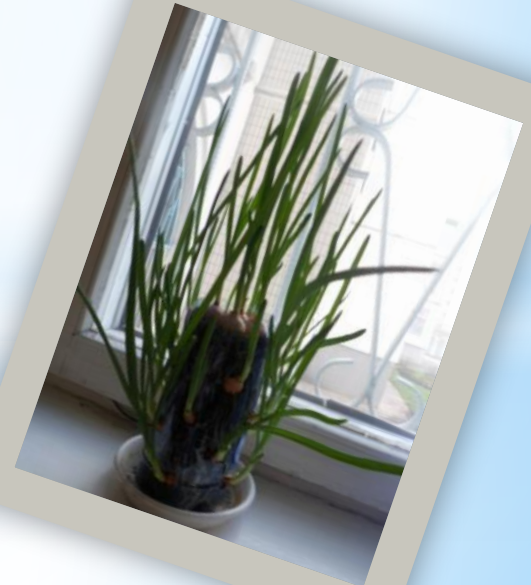
Наше «луковое дерево».