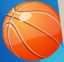
Наши маленькие чемпионы