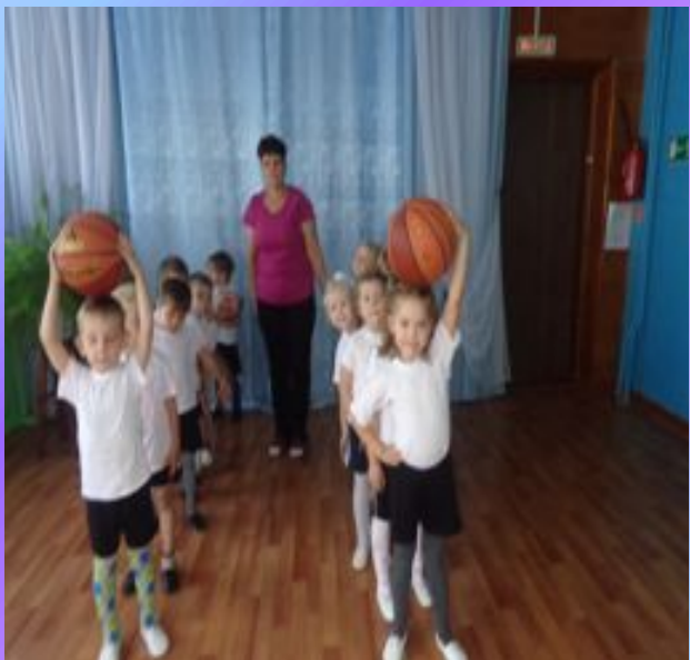
Спортивные досуги с мячом