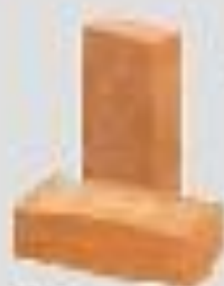
Обломки кирпича, бетона