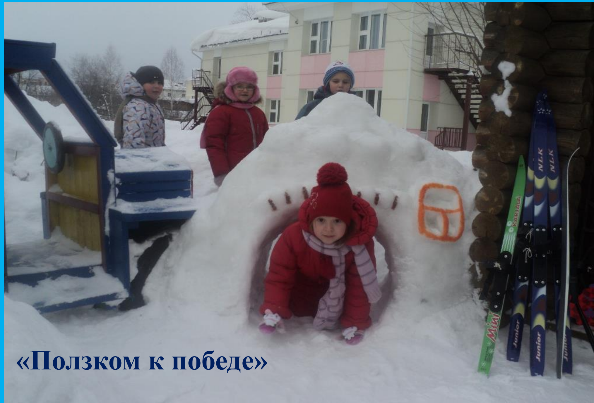
«Ползком к победе»