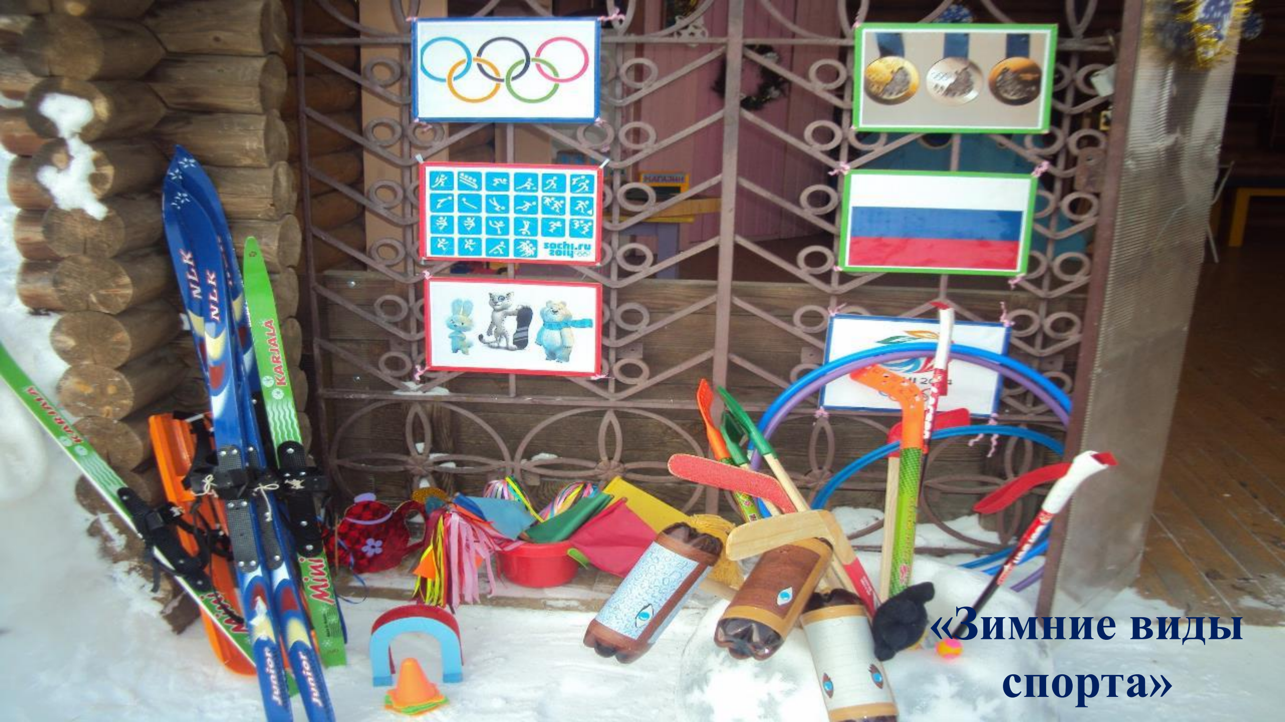
«Зимние виды спорта»