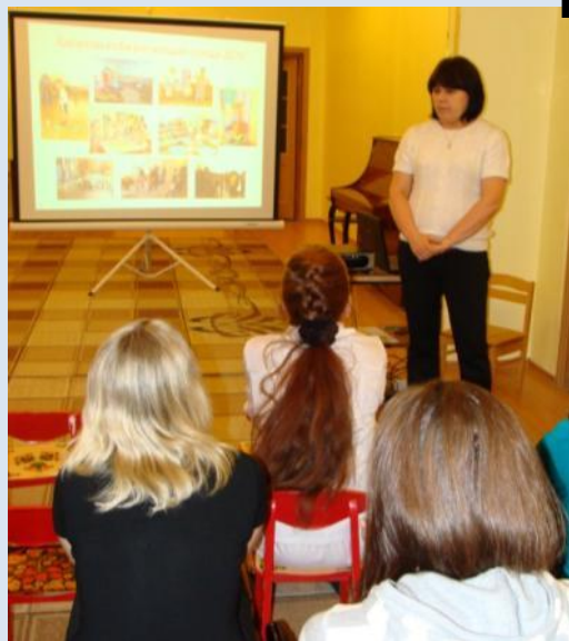
Общее родительское собрание