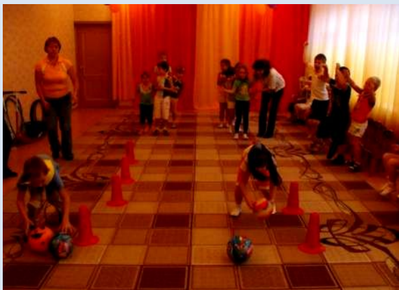
Реализация проекта «Растим чемпиона»