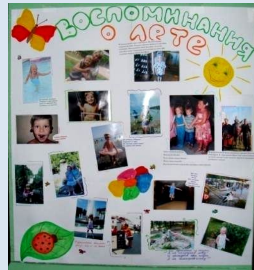
Конкурс «Воспоминание о лете»