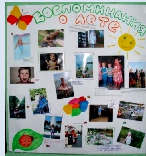
Конкурс «Воспоминание о лете»