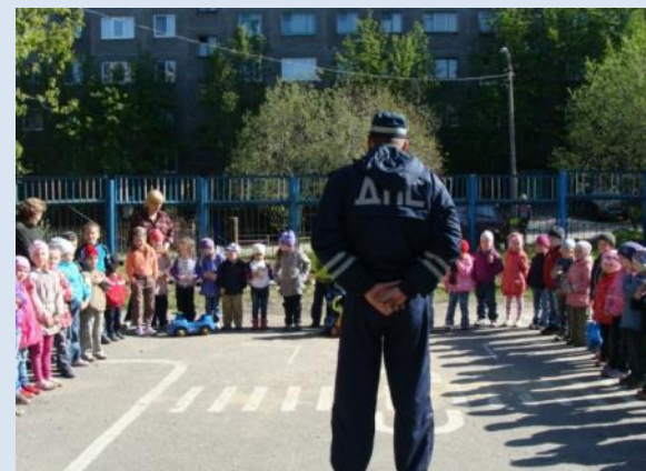
Встреча с инспектором ГИБДД