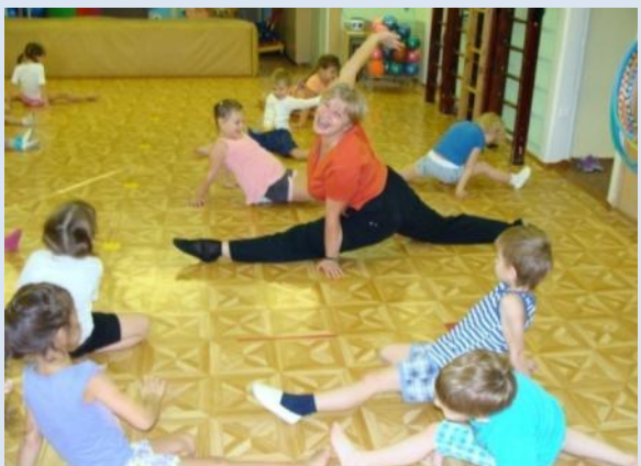
Кружок «Спортивный калейдоскоп»