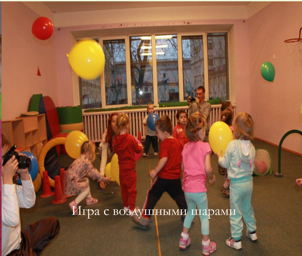
Игра с воздушными шарами