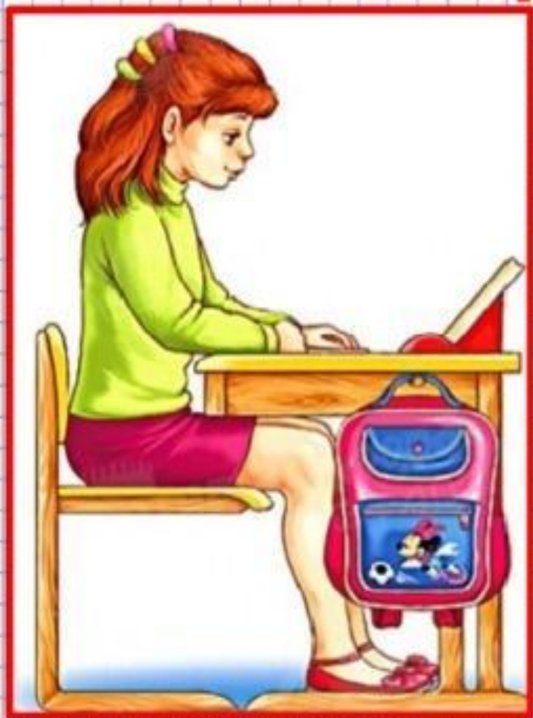
Правильная посадка при чтении