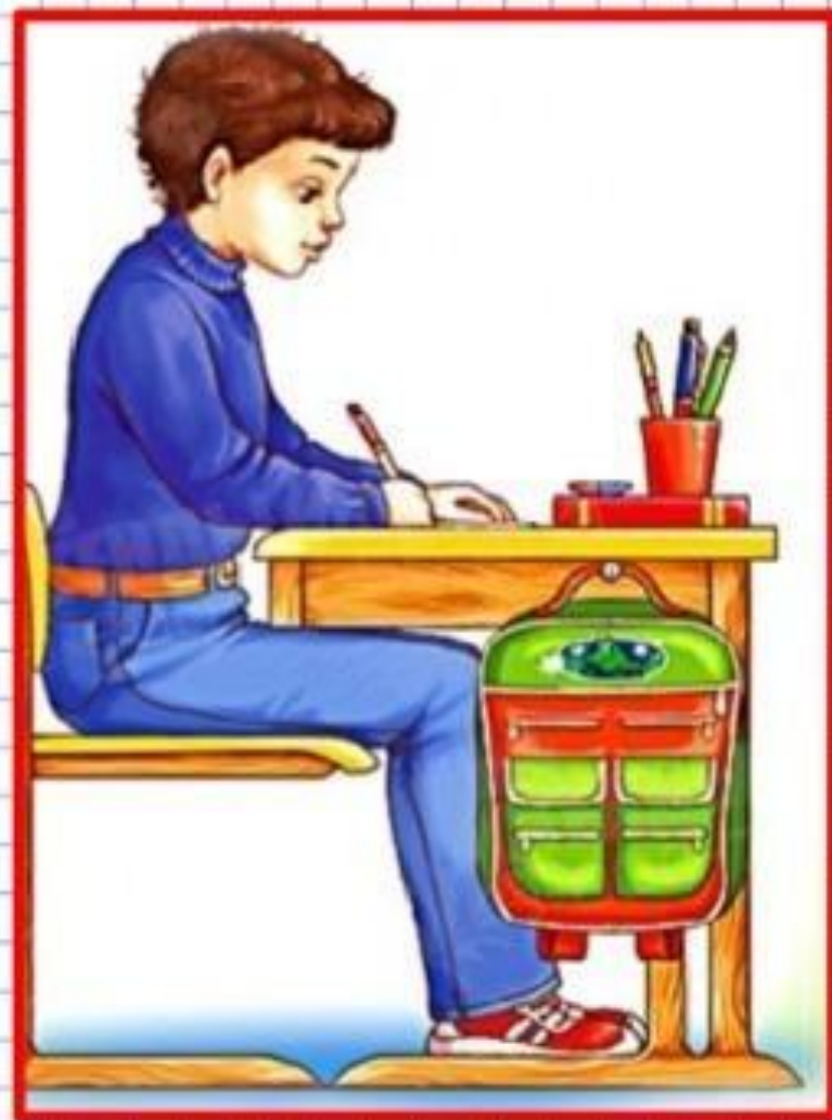
Правильная посадка при письме