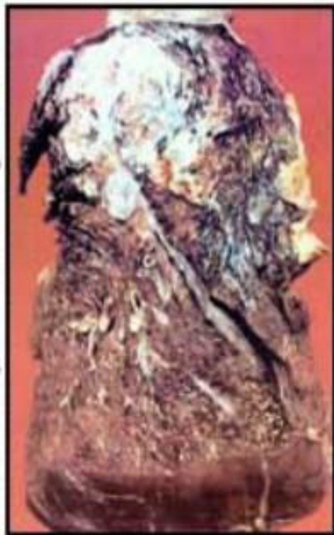
Больная ткань легкого