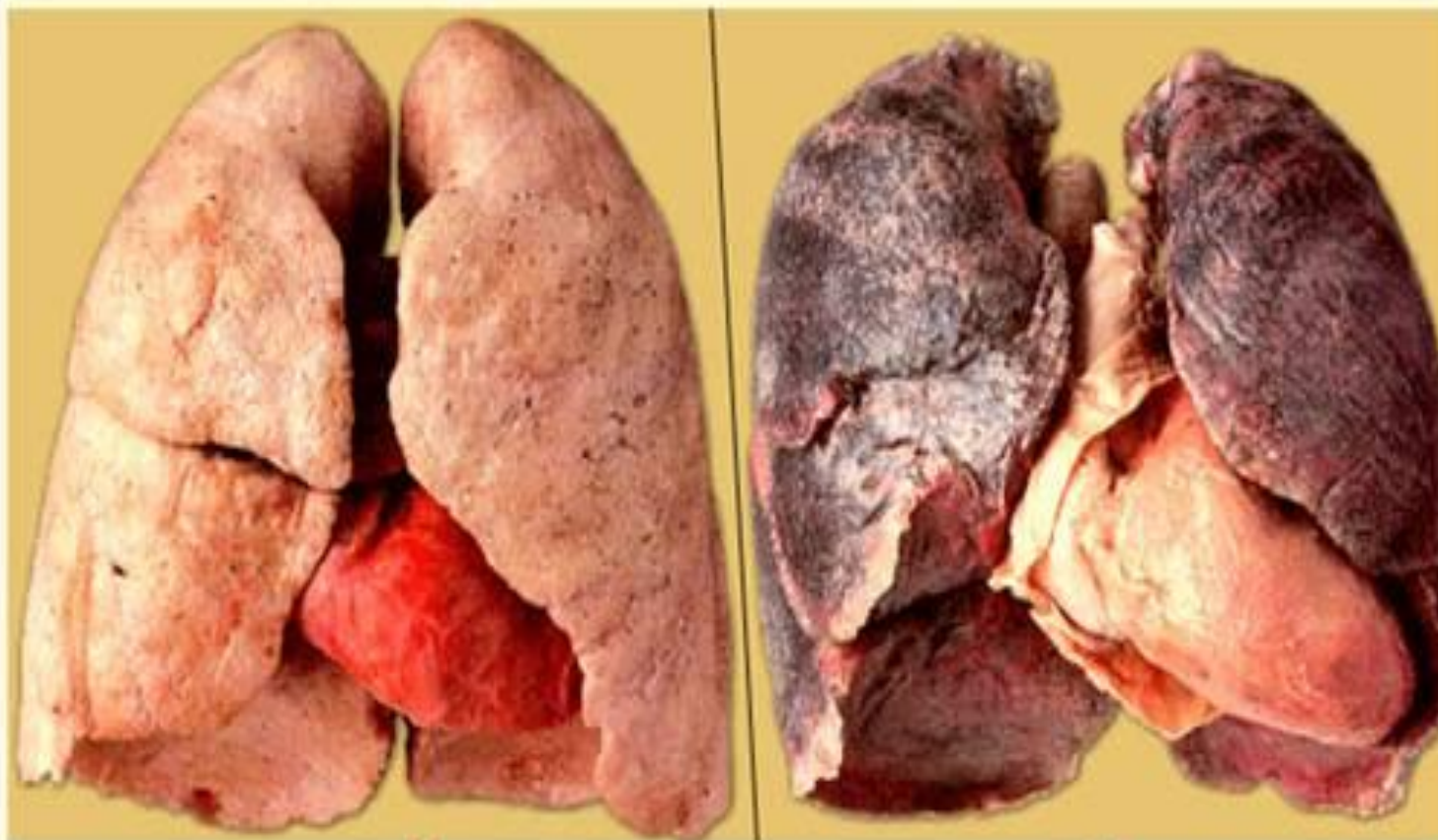
↑ Легкие здорового человека