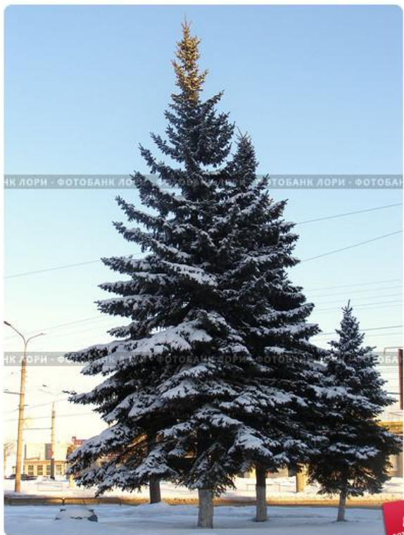
Ель в городе