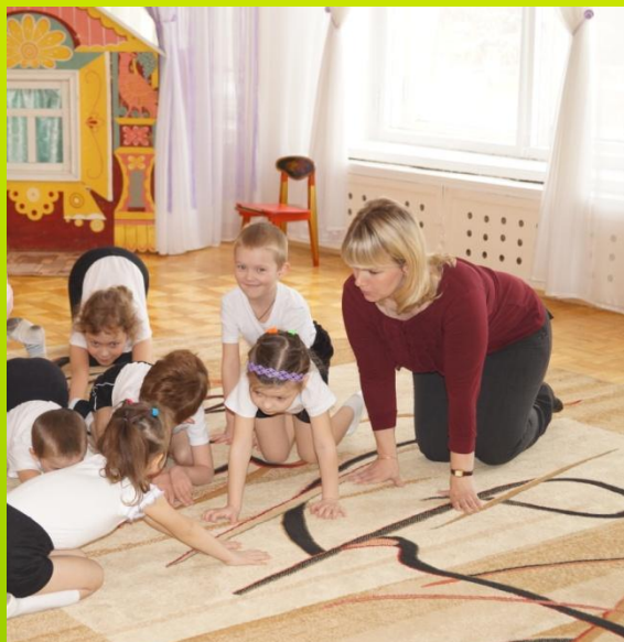
На совместных развлечениях