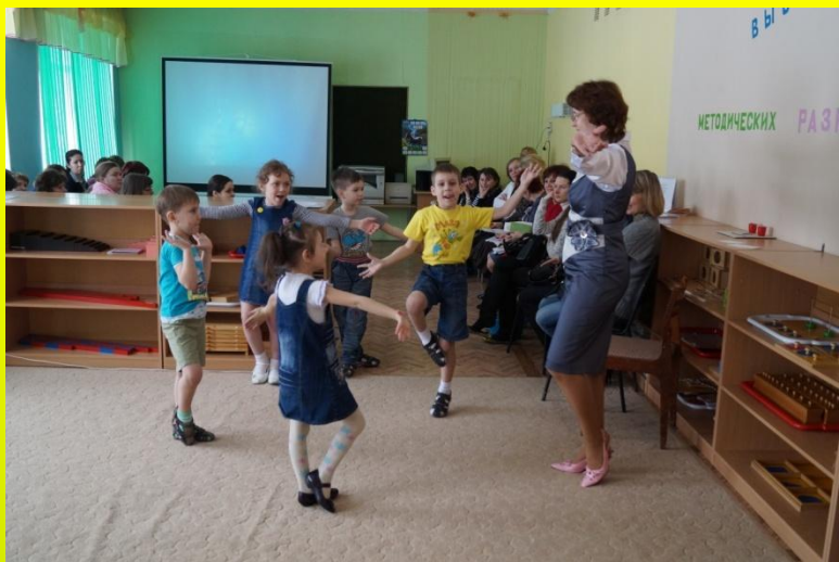
На занятиях учителя-дефектолога