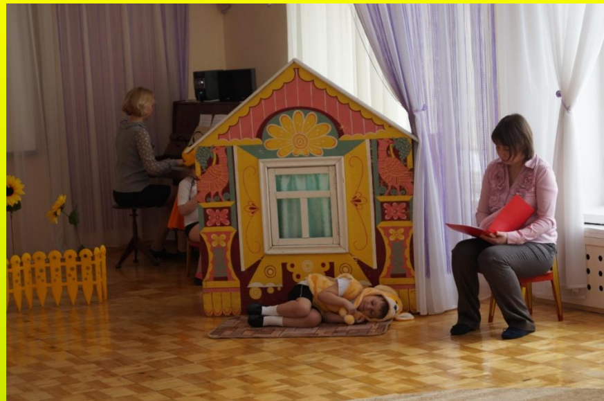
На занятиях театрализованной деятельностью