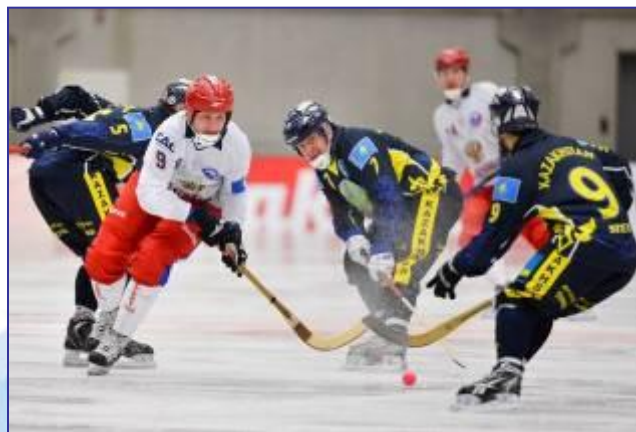
Хоккей с мячом