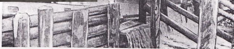
На снимке строительство запряжки и пожарного водоема в колхозе «Борьба» осуществляется силами колхозников при активном участии членов ДПД в период подготовки к общественному смотру.