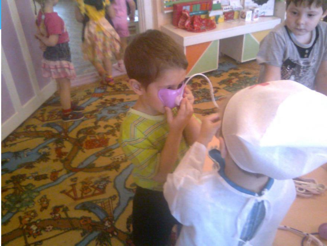
На приеме у врача