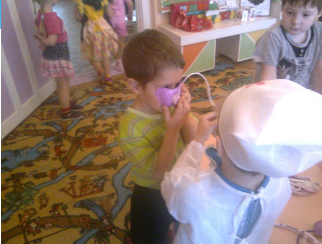
На приеме у врача