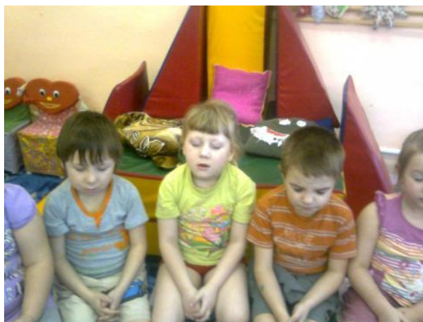
Упражнение «День, ночь»