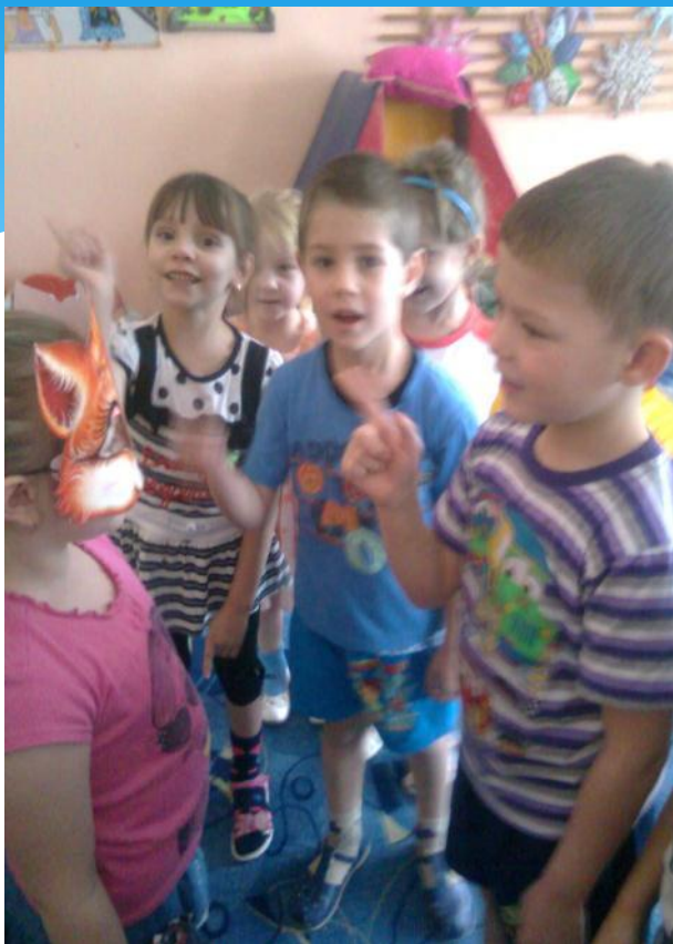
Народная игра «Белые гуси»