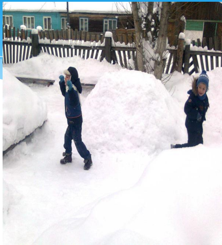
Подвижная игра «Раз, два, три к дереву беги»