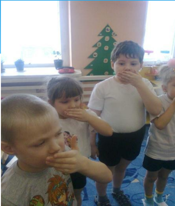
Упражнение «Дует ветерок»