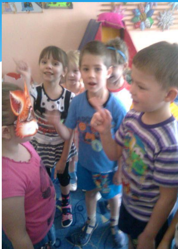
Народная игра «Белые гуси»