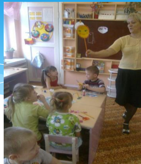
Упражнение «Солнышко и тучки»