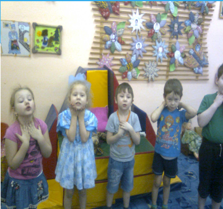
Массаж «Обезьяна Чи –чи-чи»