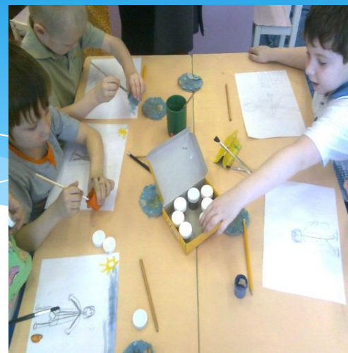
Готовимся к выставке «О спорт ты мир»