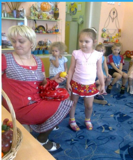
Занятие «Витамины в жизни человека»