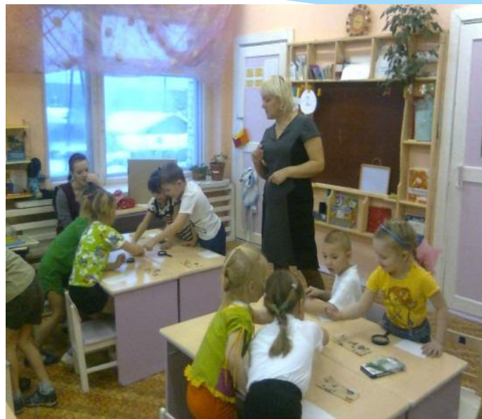
Опыт «Наши пальчики»