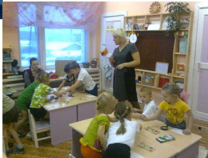
Занятие «Как сохранить свою кожу здоровой»