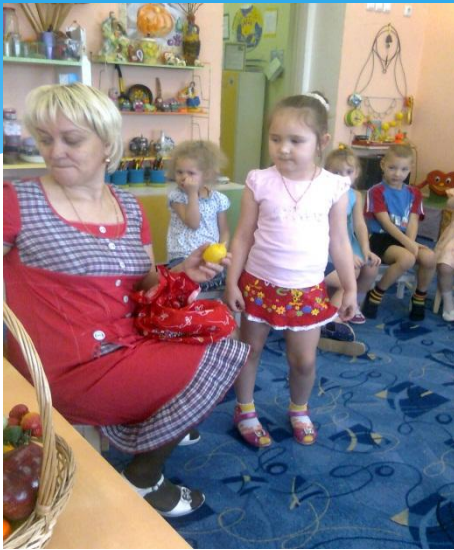
Занятие «Витамины в жизни человека»