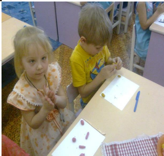
Занятие лепка «Человек»