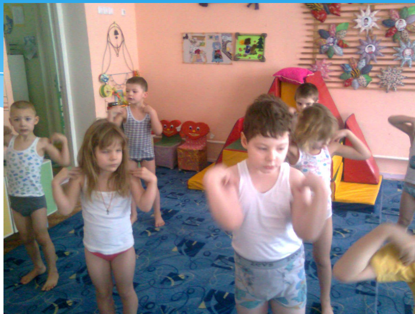
«Гимнастика после сна»