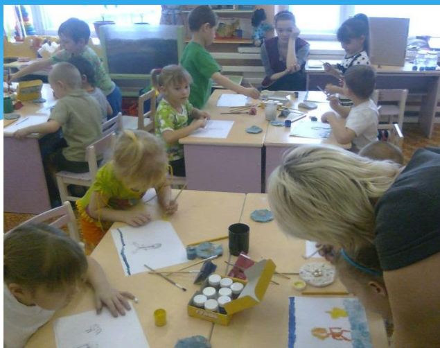
Занятие рисование «Я занимаюсь спортом»