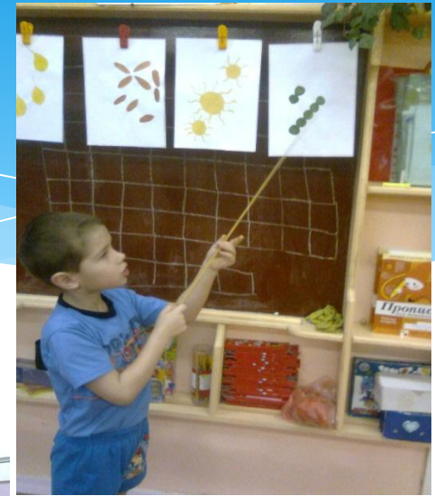
Занятие «От куда берется болезни»