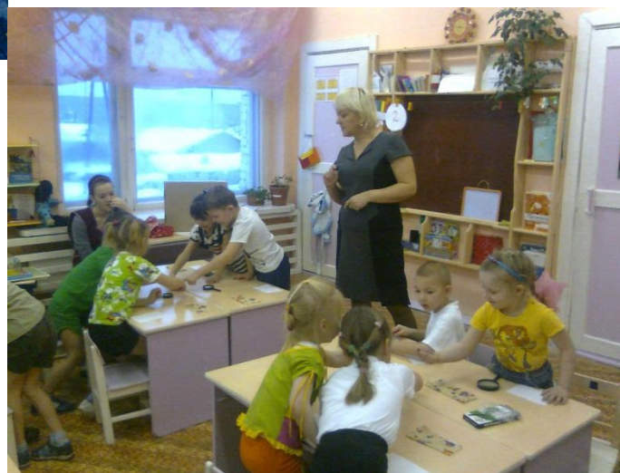
Занятие «Как сохранить свою кожу здоровой»