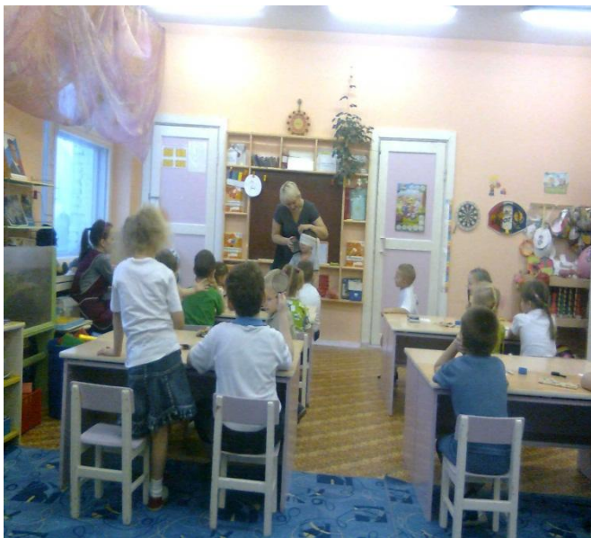
«Что чувствует наша кожа» Эксперимент «Холодное – горячее»