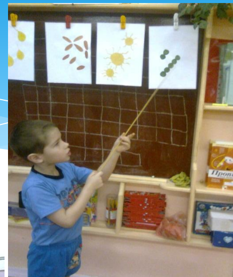
Занятие «От куда берется болезни»