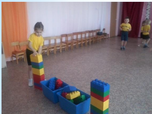
Игра-соревнование: «Самая высокая башня»

Из кубиков дети могут построить полноразмерные фигуры, стены, башни и другие конструкции. Организуются игры-соревнования: «Самая высокая башня», «Кто первым построит дорожку», «Попади в коробку», «Построй светофор» и др.