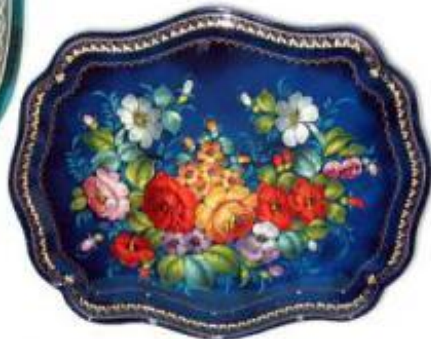
букет в раскидку