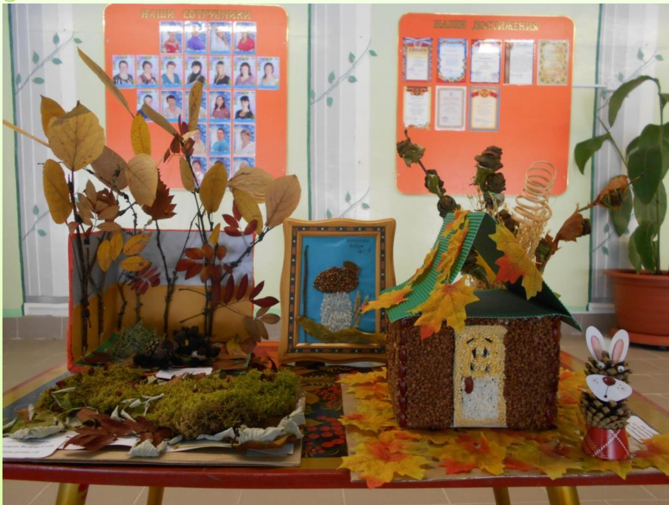
Работы средней группы «А» «Мультишки»