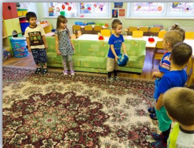
Совместная игра «Шар по кругу»