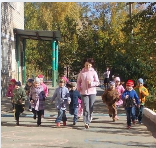
Детский сад "Теремок"