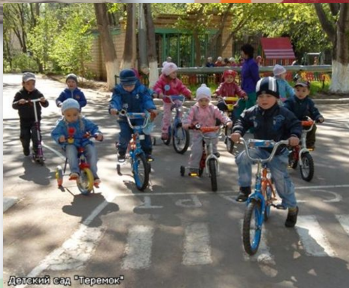
Детский сад "Теремок"