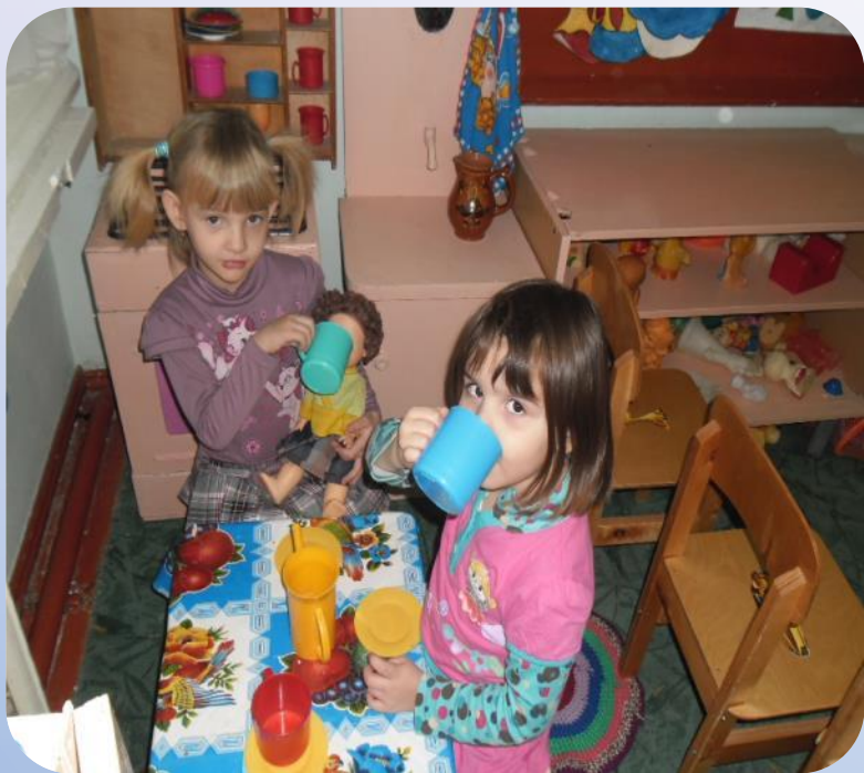
«Напоим куклу чаем»