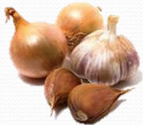
Лук и чеснок

Растения, содержащие аллицин, который блокирует особые ферменты, способствующие распространению вирусов в организме.