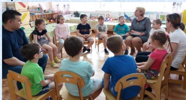
Упражнение «Ласковое имя»

«Установление контакта (психологические игры)»