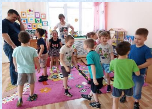
Упражнение «Доброе тепло»