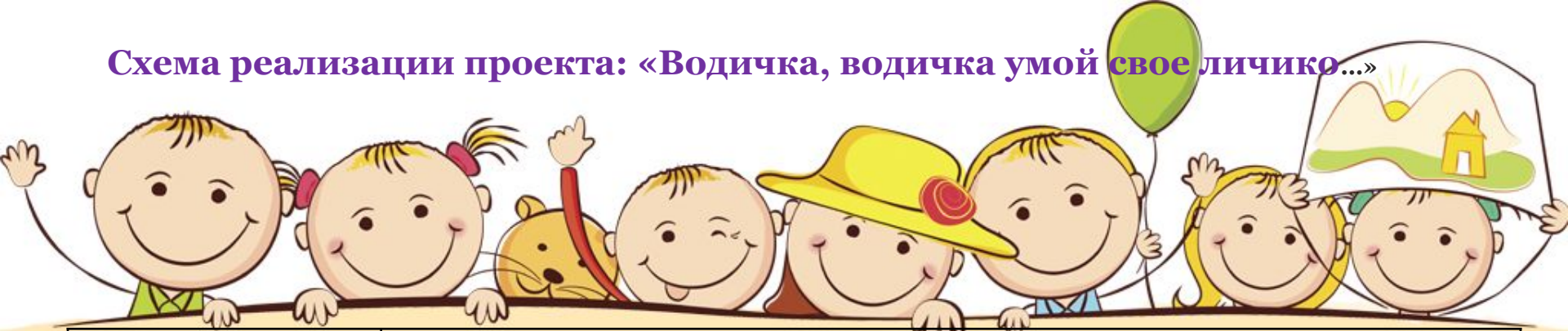
Схема реализации проекта: «Водичка, водичка умой свое личико...»