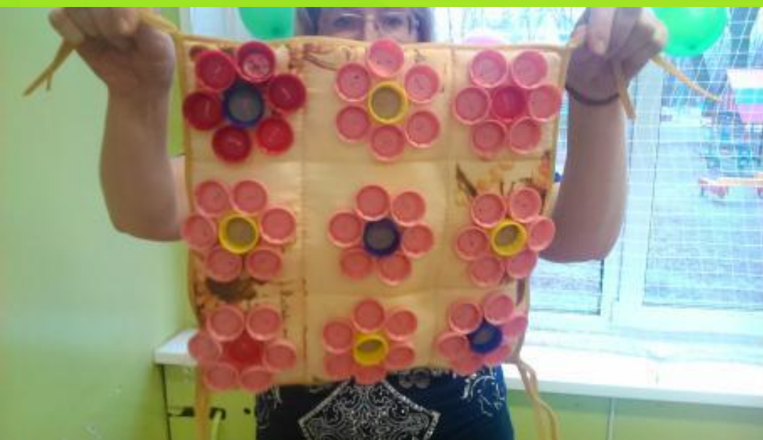
массажер из пластиковых крышек