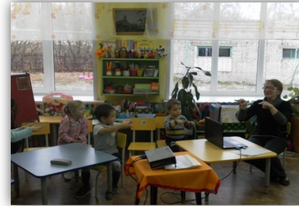
мастер – класс «Играем пальчиками – развиваем речь»