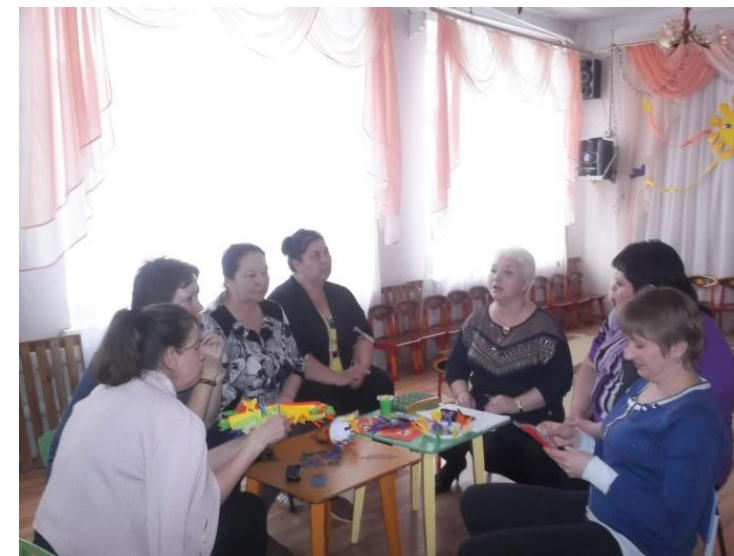
консультация «Пальчиковые игры с предметами»