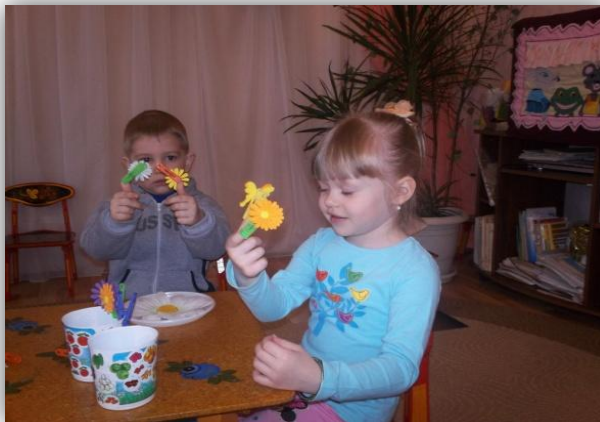
семинар – практикум «Играем пальчиками»