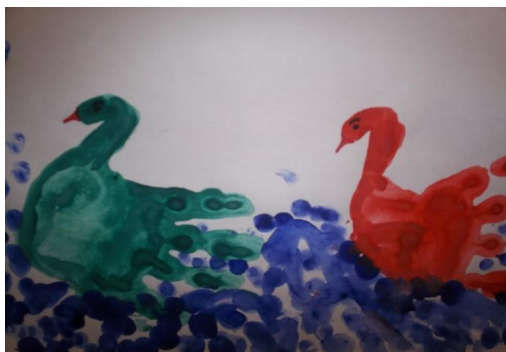
проведение конкурса рисунков детей и родителей «Рисуем пальчиками и ладошками»;