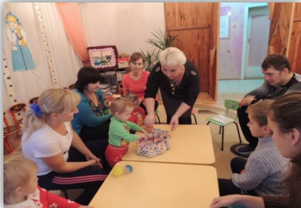
семейная гостиная «Путешествие в мир пальчиковых бассейнов»