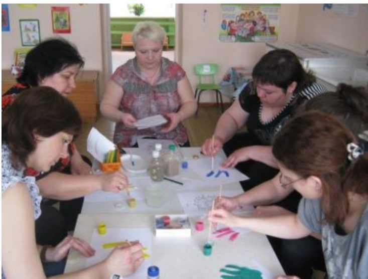
семинар – практикум «Играем пальчиками»