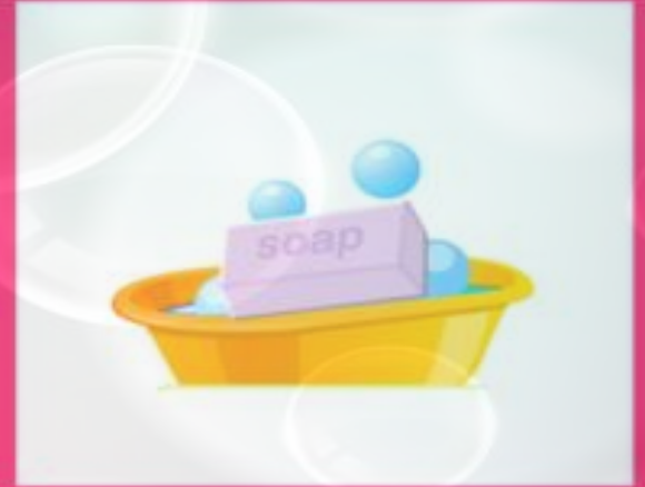
МОЕМ РУКИ С МЫЛОМ