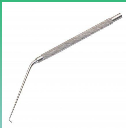
Крючок для удаления инородных предметов