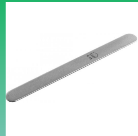
Шпатель для языка