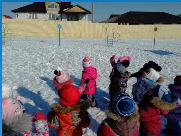
Наблюдение «за птицами»

Наблюдения во время прогулки проводятся с целью ознакомления детей с животным и растительным миром, погодными явлениями.