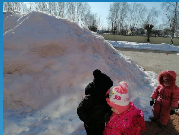
наблюдение «за снегом»