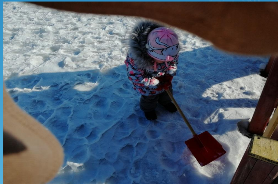
Расчистка участка от снега