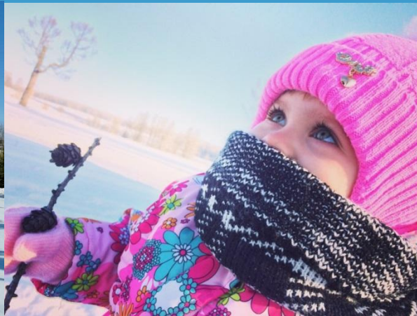
Наблюдение «за зимними деревьями»