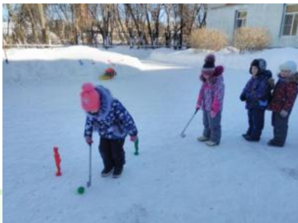
Конец учебного года