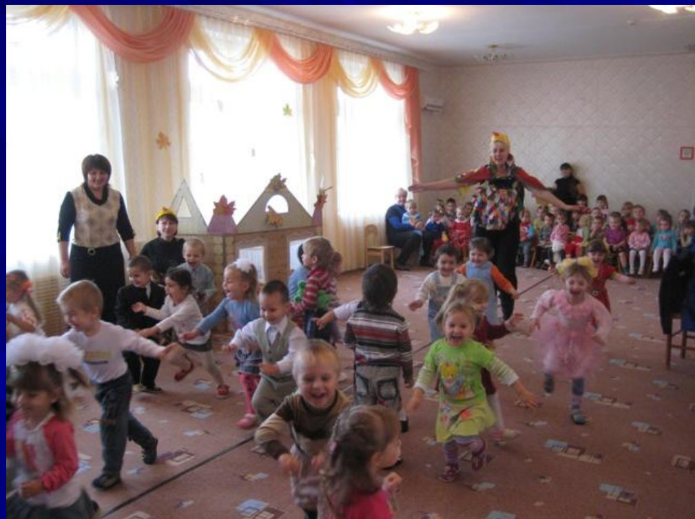
В гостях у петушка.