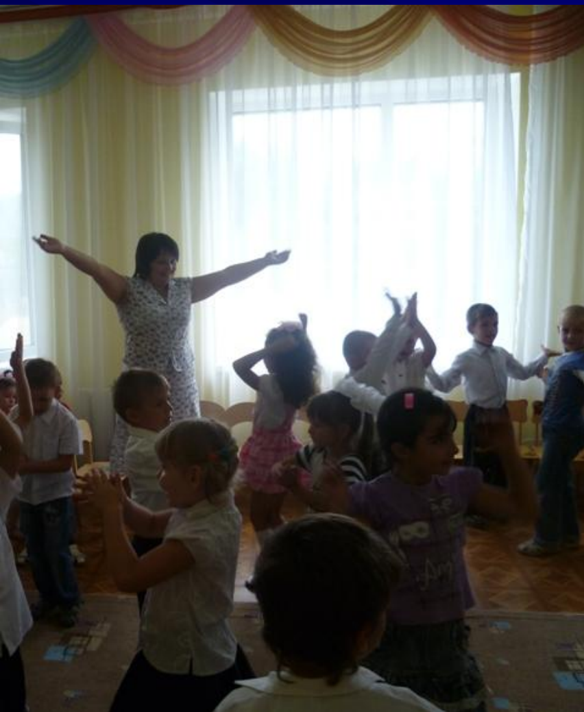
Мы немного отдохнем.