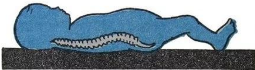
правильно (ровный твердый матрас и отсутствие подушки)

Так как физкультурные занятия с детьми в детском саду проводятся 3 раза в неделю ( в средней, старшей группах), то этого недостаточно для профилактики нарушений осанки и плоскостопия. Необходимо родителям в повседневной жизни следить за правильным положением тела, создавать необходимые условия в семье (спать на жесткой кровати и т.п.)