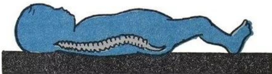
правильно (ровный твердый матрас и отсутствие подушки)

Так как физкультурные занятия с детьми в детском саду проводятся 3 раза в неделю ( в средней, старшей группах), то этого недостаточно для профилактики нарушений осанки и плоскостопия. Необходимо родителям в повседневной жизни следить за правильным положением тела, создавать необходимые условия в семье (спать на жесткой кровати и т.п.)