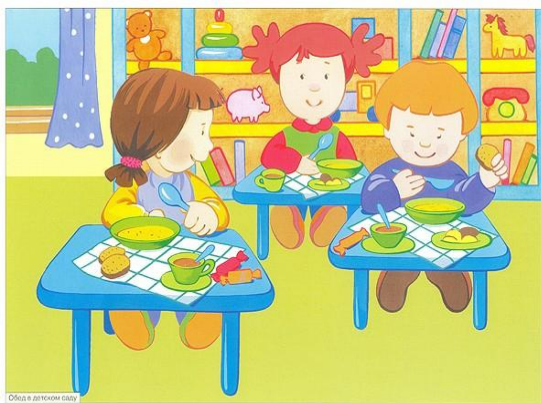
Обед в детском саду