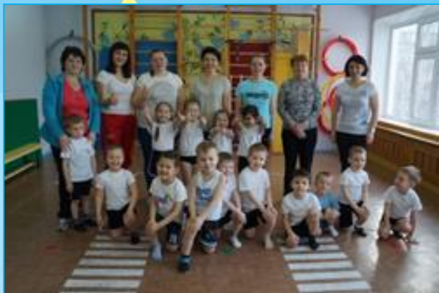
Утренняя гимнастика совместно с родителями