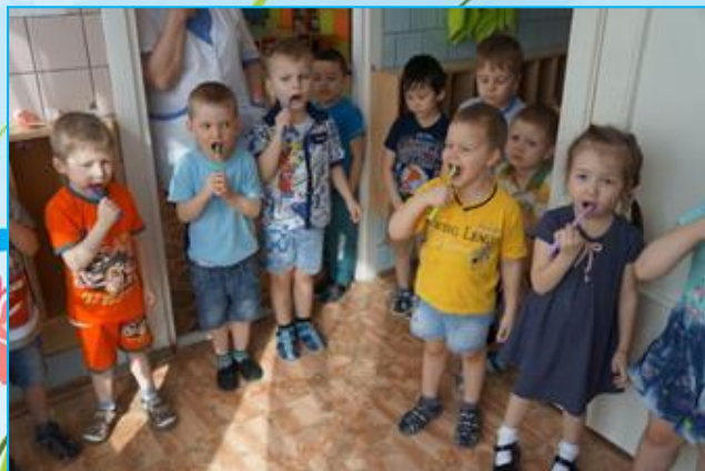
Практикум «Как правильно чистить зубы?»