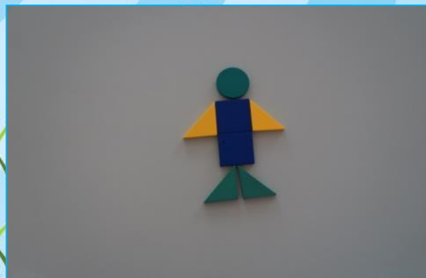
Конструирование из геометрических фигур