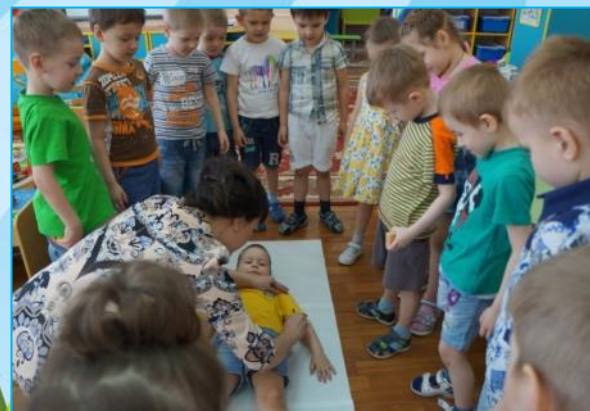
Создание макета «человек»