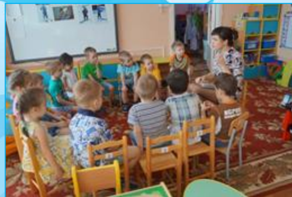
Итоговая беседа на тему «Здоровому все здорово»