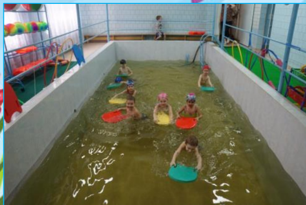
Занятия в бассейне