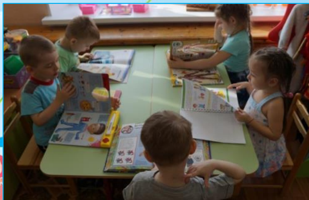
Рассматривание иллюстраций в энциклопедии