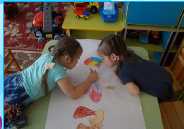
Рисование внутренних органов