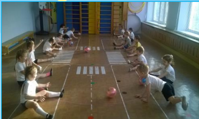
Занятия по физкультуре