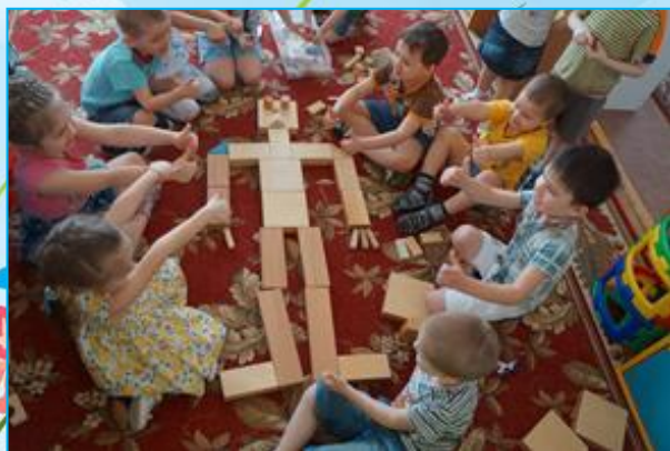
Конструирование человека из деревянного конструктора