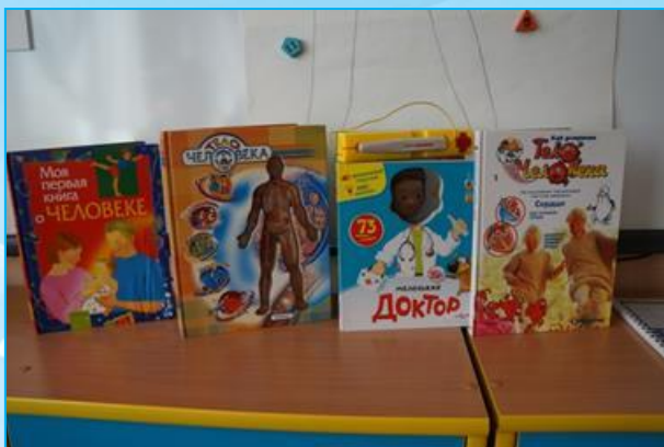
Выставка книг по теме «Здоровье», «Человек»