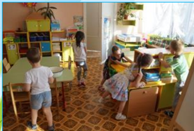
Уборка в группе