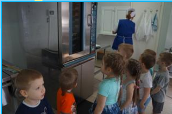
У «чудо – печки»