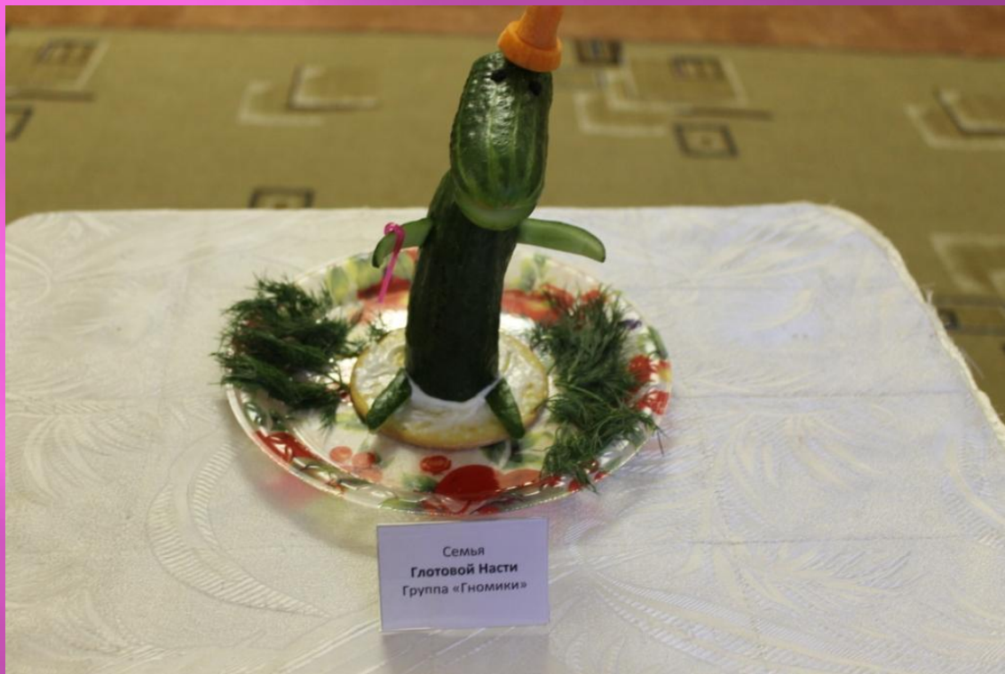
Семья Гловой Насти Группа «Гномики»