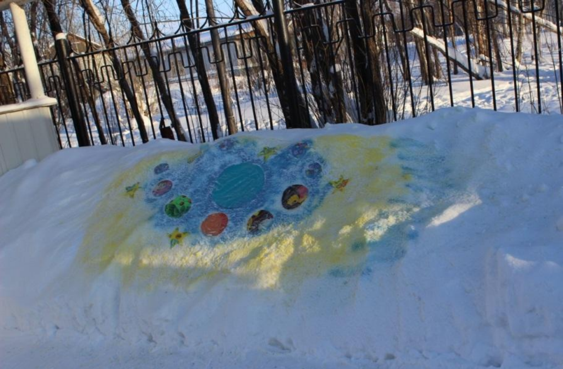
«Карта вселенной» (мишень для метания в цель)