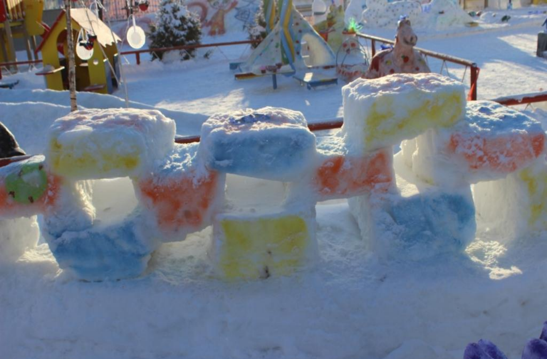
«Крепость «Чиу- чиу» (для перелезания)