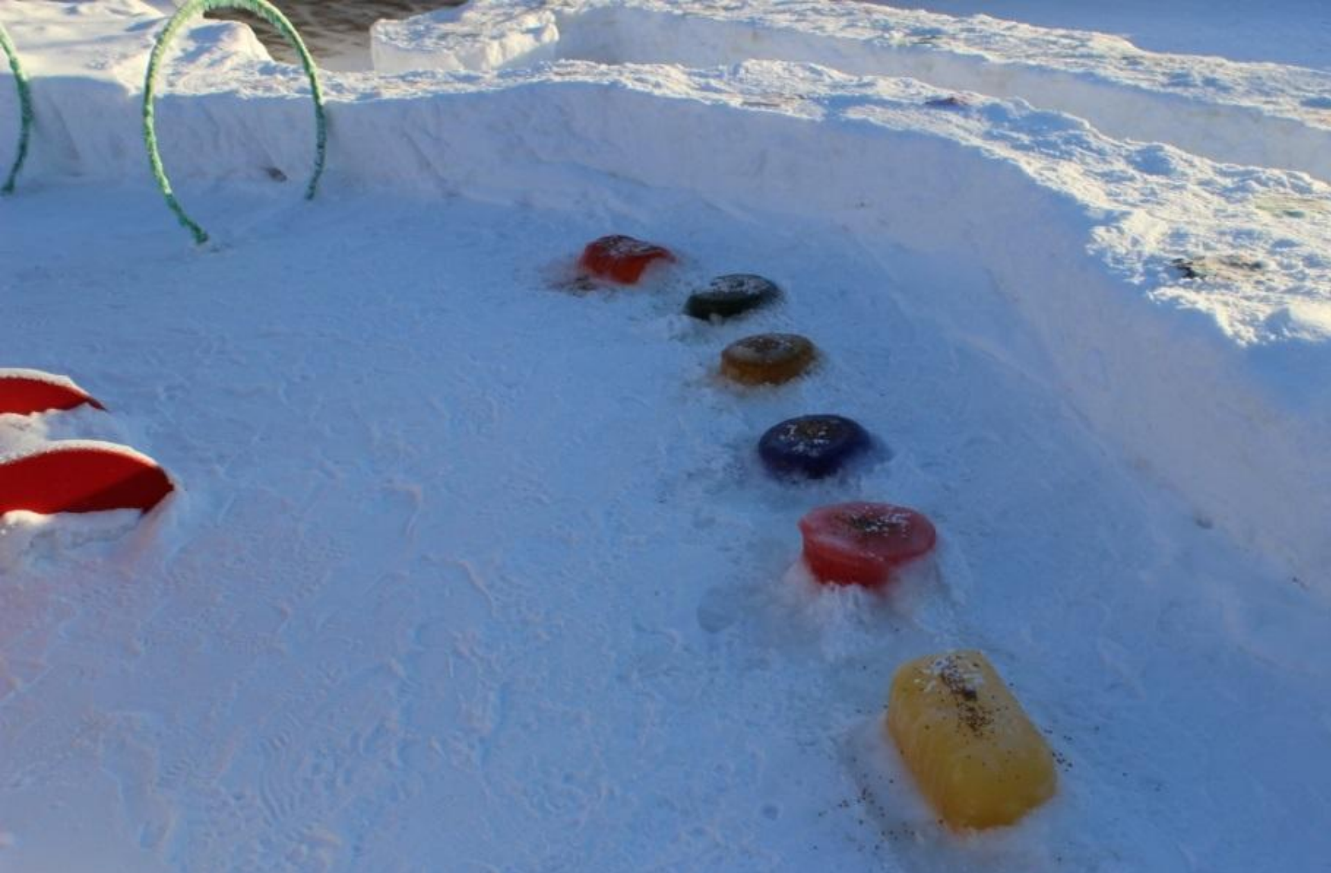
«Следы Большой Медведицы» (для перепрыгивания, перешагивания, координации)