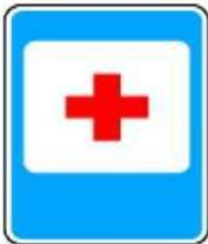
7.1 Пункт первой медицинской помощи