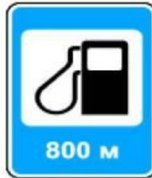
7.3 Автозаправочная станция