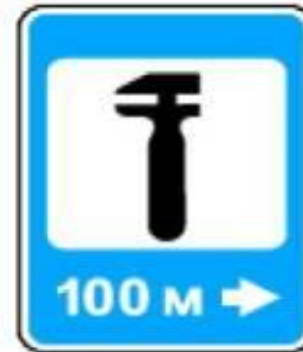
7.4 Техническое обслуживание автомобилей