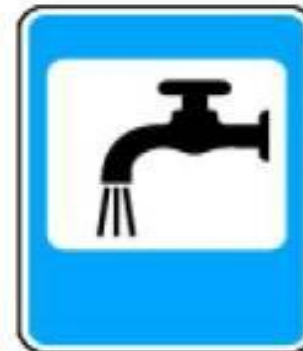
7.8 Питьевая вода

Знаки бывают разные. Попробуй догадайся, что обозначают вот эти.