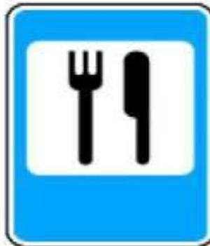
7.7 Пункт питания