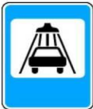
7.5 Мойка автомобилей