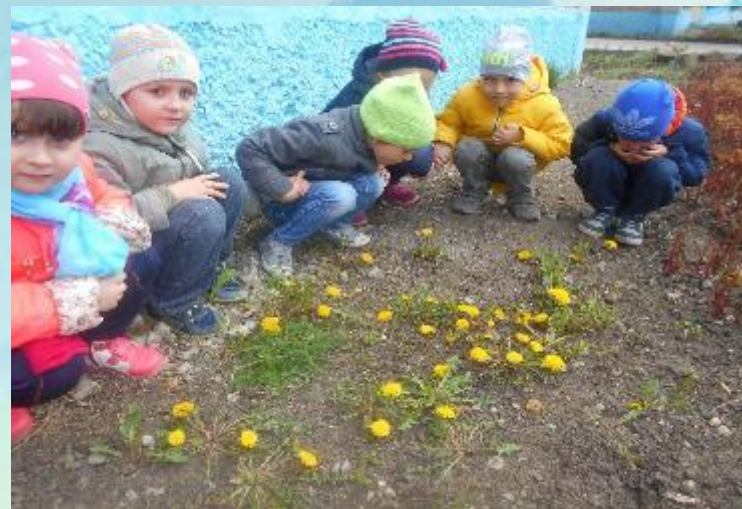
«Носит одуванчик жёлтый сарафанчик»