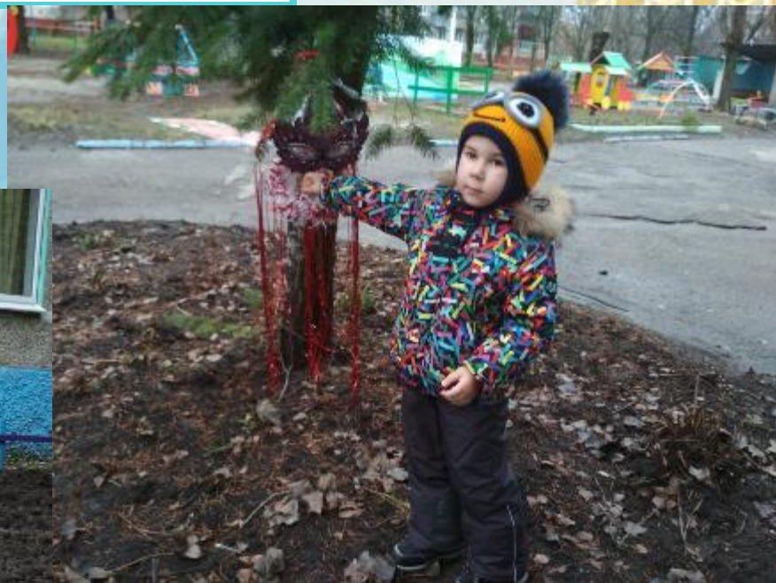
«Подкармливаем птиц зимой»