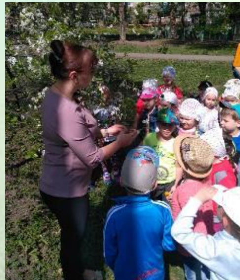
«Вишня в цвету»