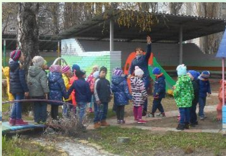
«Надела берёзка серёжки»