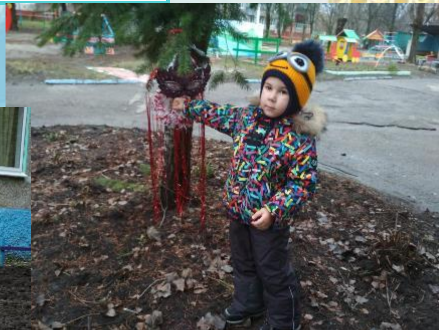
«Подкармливаем птиц зимой»