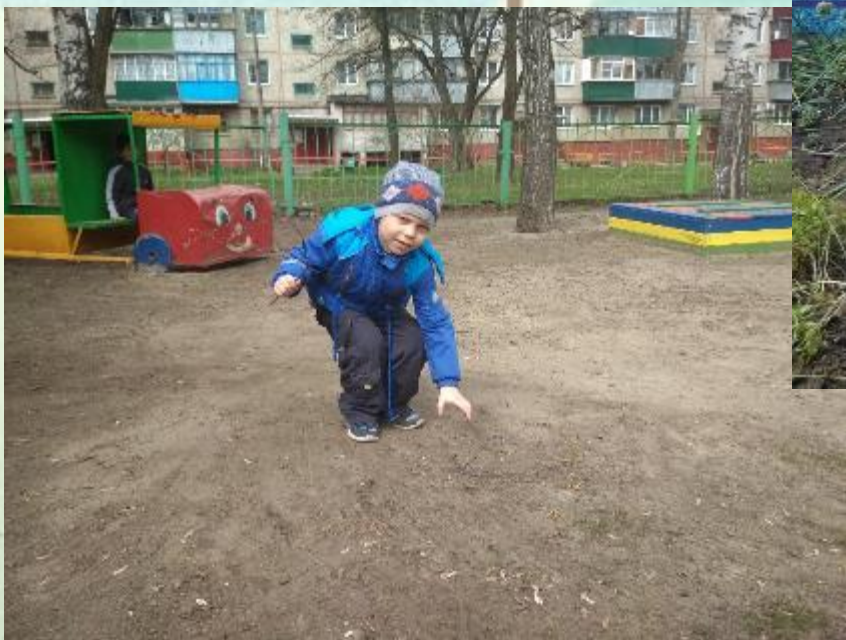
«Уборка веточек на участке»