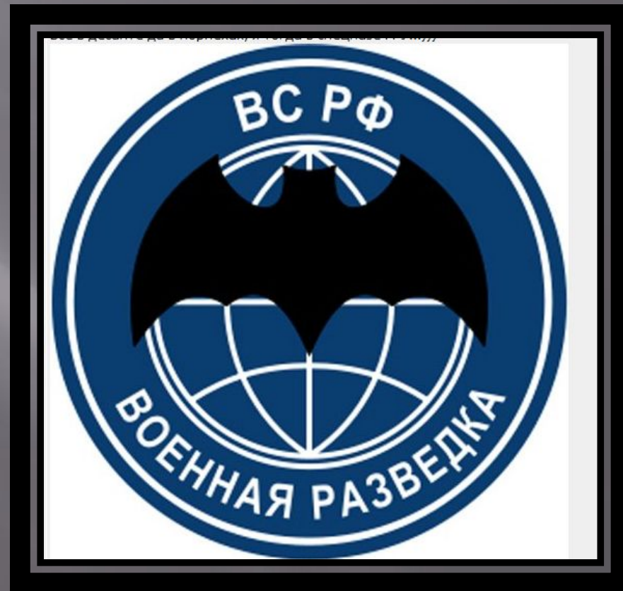
II – ОЙ ВЗВОД