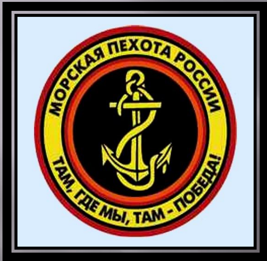
I – ЫЙ ВЗВОД