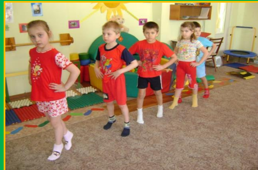
Разные виды ходьбы