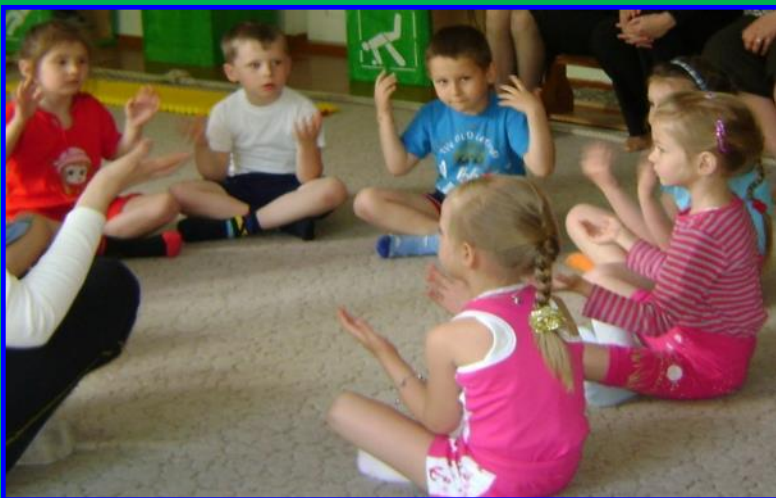
Упражнения на релаксацию