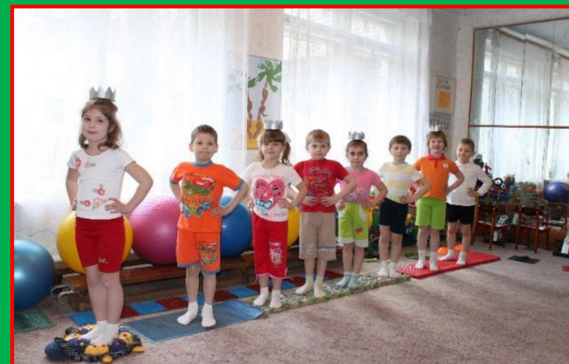
Ходьба по коррекционным дорожкам