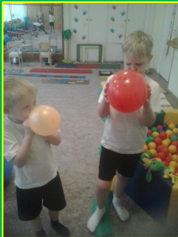
Упражнения на развитие дыхания