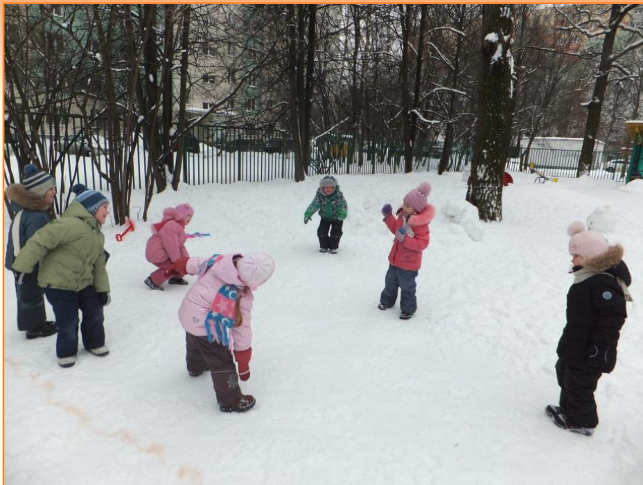
«Охотник и зайцы»