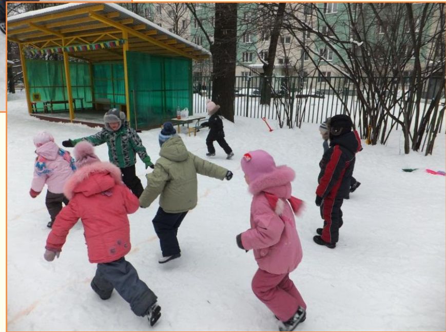
«Волк во рву» (упрощенный вариант)