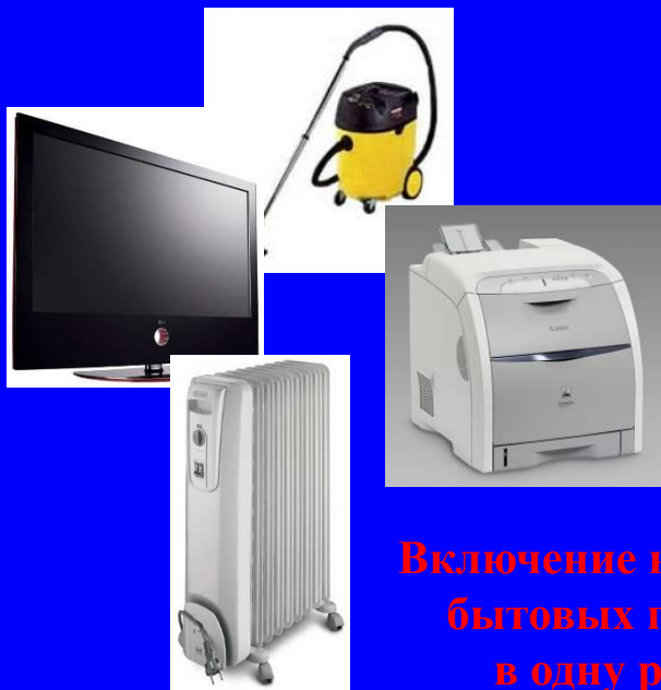
Включение нескольких бытовых приборов в одну розетку