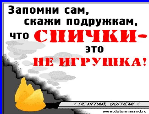
Шалости детей: игра спичками, электроприборами и др.