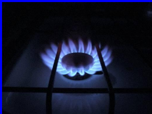
Неисправность бытовых газовых приборов