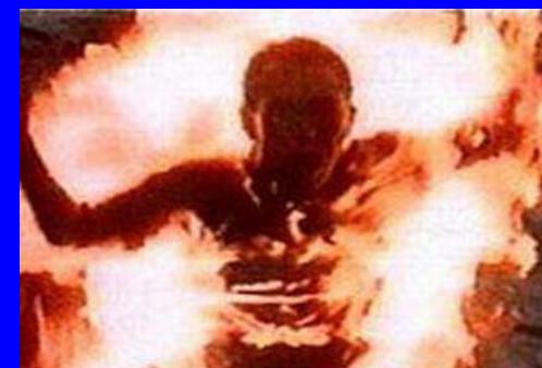
Небрежность при хранении легковоспламеняющихся материалов