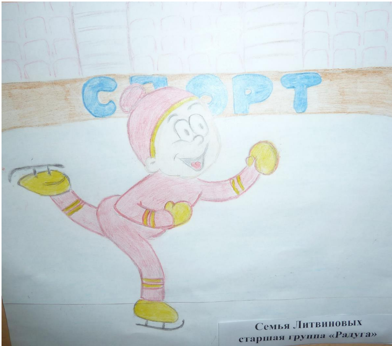
Семья Литвиновых старшая группа «Радуга»