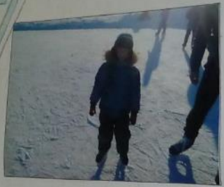
Будней играют настоящие мужчины

Кто-то выше, кто дальше, Кто-то лучше и быстрее, Мыры спорт без слез раскажет, Кто сегодня всех сильнее!