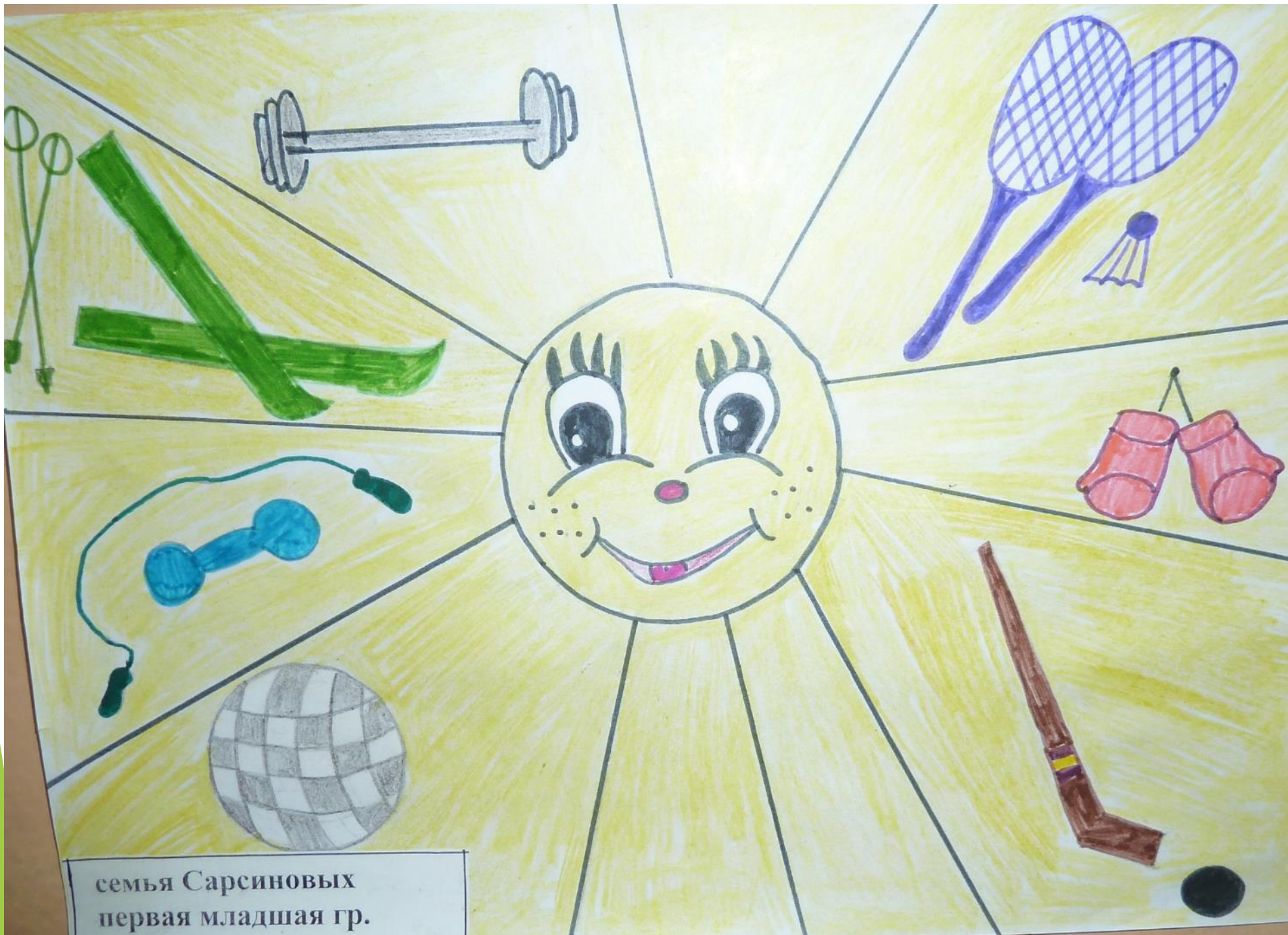
семья Сарсиновых первая младшая гр.