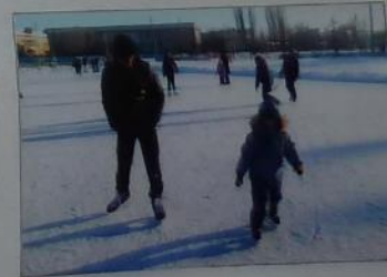
Гл. редактор: Мамов Улья Александрович.