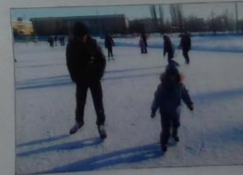
Гл. редактор: Мамов Улья Александрович.