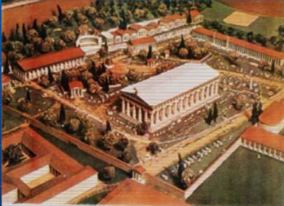
Макет храму Зевса в Олімпії

Олімпійські ігри зародились у стародавній Греції і регулярно проводилися понад тисячу років. Безпосередньо зародження Олімпійських ігор пов'язують із іменем грецького героя Геракла. Ігри у Стародавній Греції проводились один раз на чотири роки на честь бога Зевса. Всі змагання та конкурси проходили в давньогрецькому поселенні Олімпія.