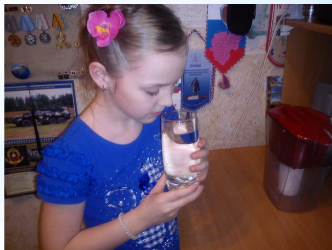
4. Вода после фильтрации