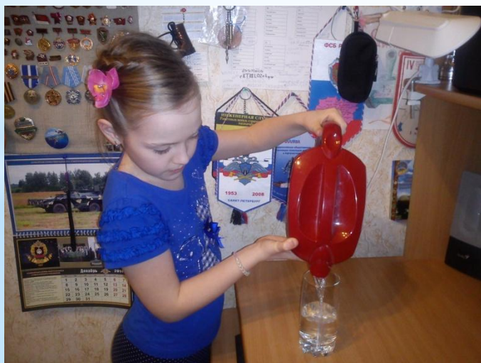
3. Сливаю воду из фильтра