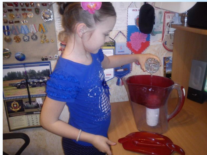
2.Наливаю воду в фильтр