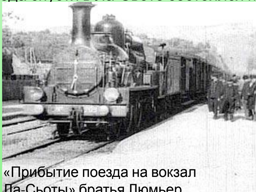
«Прибытие поезда на вокзал Ла-Сьоты» братья Люмьер